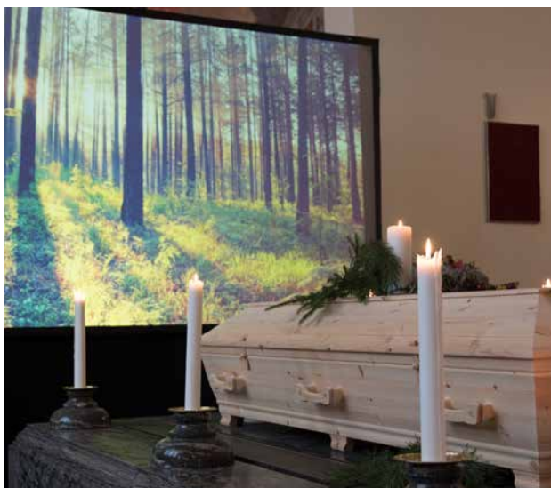
Flytta in naturen, minnen och bilder med hjälp av en storbildsskärm.