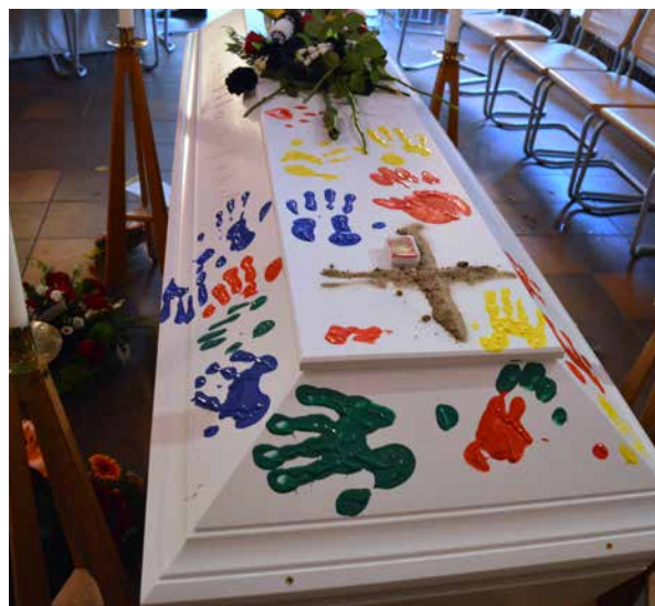
En sista hälsning med en klapp av fingerfärg.